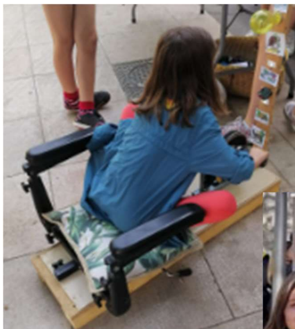
Fête de la nature