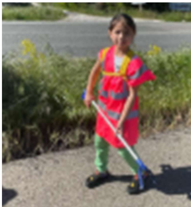
Nettoyons le Sud